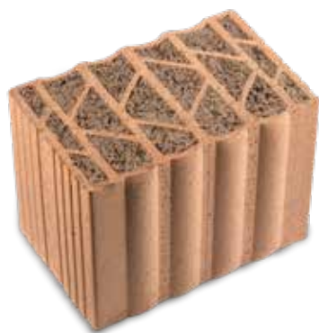
Capo garnie de laine de verre recyclée avec ECOSE® Technology