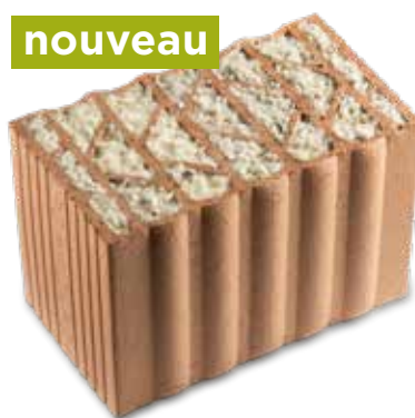
Capo LANA garnie de laine de mouton suisse