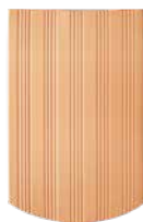
1 1/2 tuile